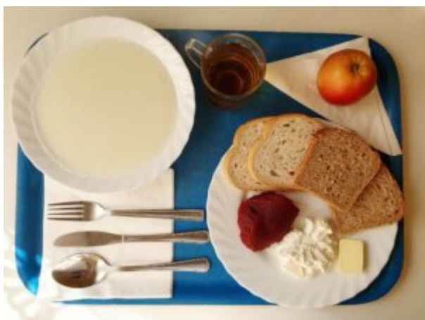
Dieta z ograniczeniem łatwo przyswajalnych węglowodanów